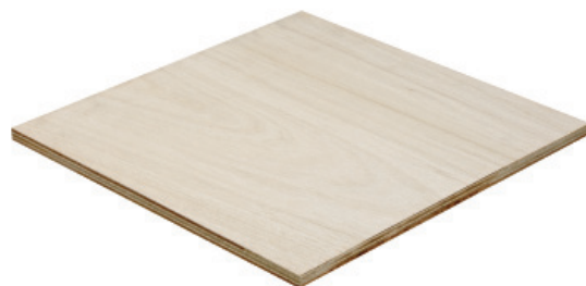
Fepcopy BB/CC MR

IHP komt automatisch met een FLEGT vergunning. Dit maakt iedere vorm van "due diligence" met het oog op de EUTR wetgeving volledig overbodig en zodoende zeer aantrekkelijk.