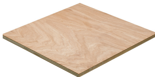
Fepcopy BB/CC WBP