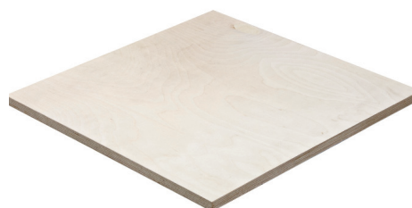
I/I - I/II (B/B - B/BB)