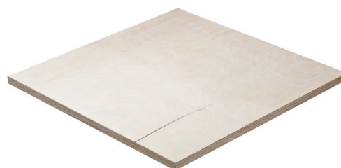
III/III - III/IV - IV/IV (CP/CP - CP/C - C/C)