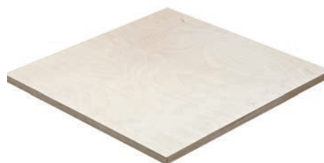
B/B - B/BB - S/BB