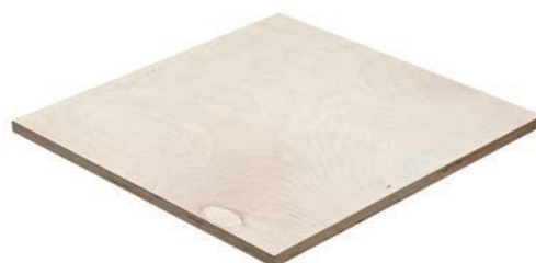
BB/BB - BB/CP - BB/C