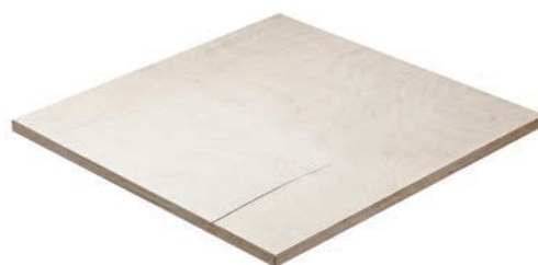
C/P - CP/C - C/C